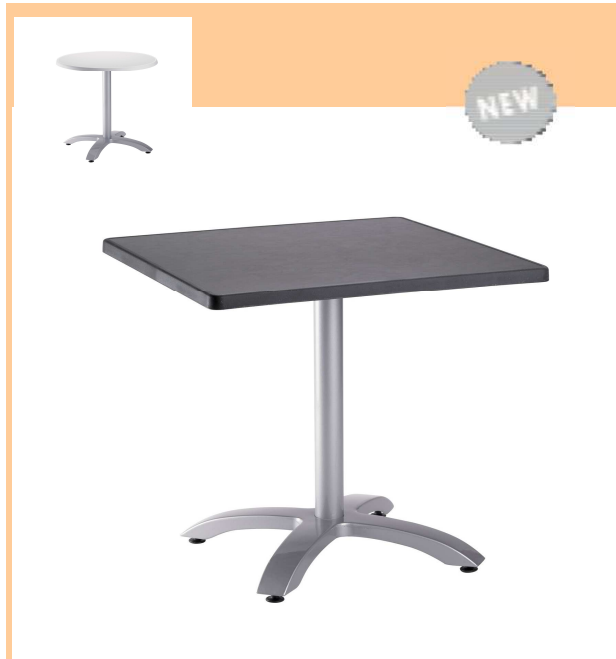
TABLE EXTERIEURE ECOFIX